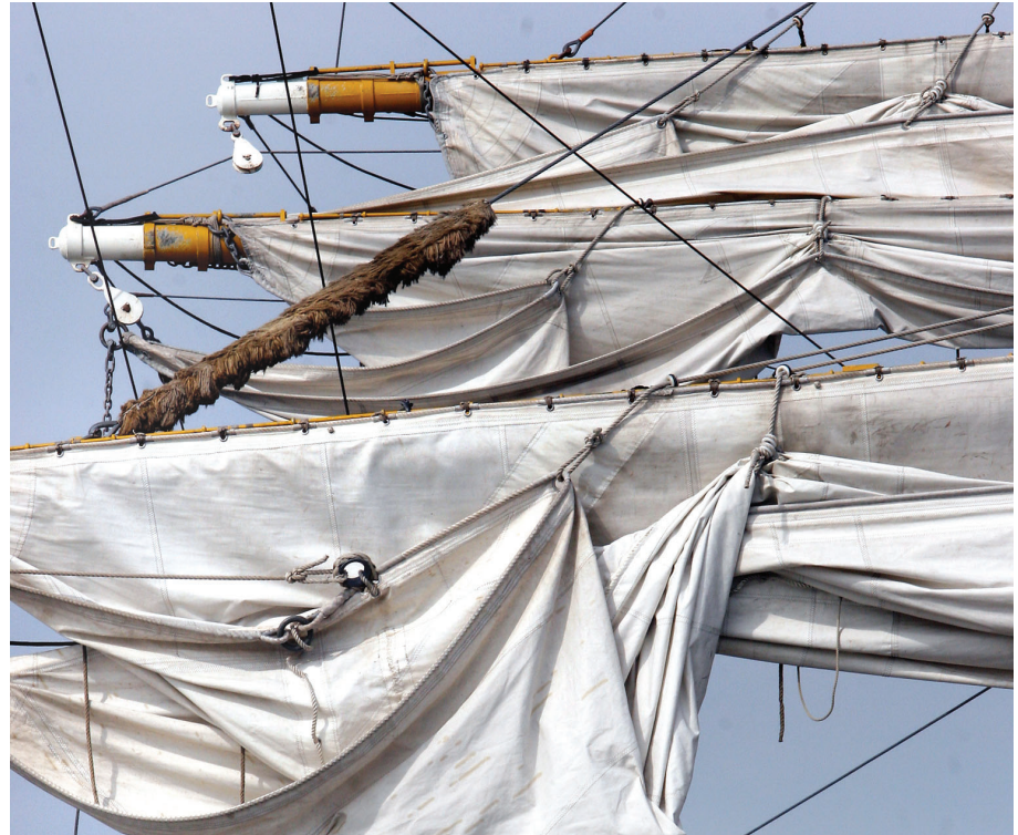
Eindrucksvoll: die Takelage der Gorch Fock.