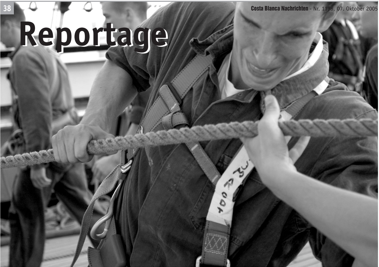
Typische Arbeit eines Offizierskadetten auf dem Segelschulschiff Gorch Fock: Seile ziehen.