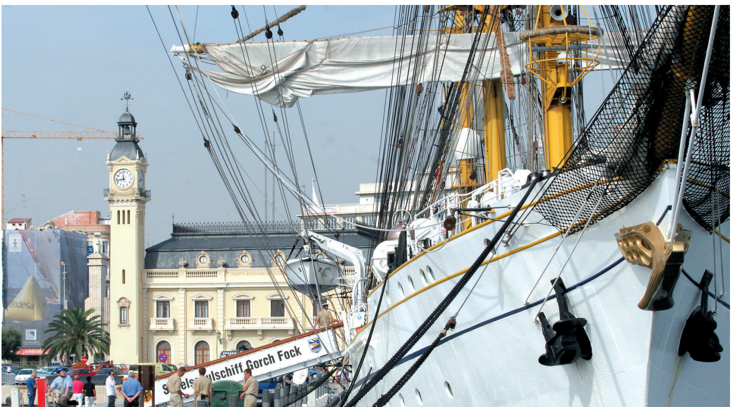
Immer im Zentrum des Interesses: das Segelschulschiff Gorch Fock der Bundesmarine im Hafen von Valencia.

verabschieden“, weiß er. „Sie sind dann ganz blass im Gesicht, hängen über der Reling und schauen den Fischen im Meer zu. Dies ist ganz normal.“ Nach ein paar Tagen schließen sich die Reihen wieder. Dann kehrt auch wieder Farbe ins Gesicht der Kadetten zurück – beim tagtäglichen Ziehen an den Seilen.