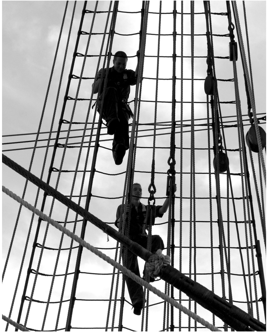
Abenteuerlich: Der Aufstieg in den Wanten.