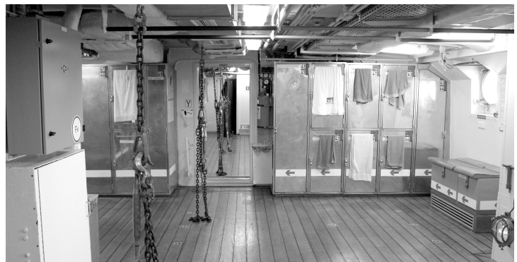
Hier nächtigen 30 Mann in Hängematten – in drei Lagen.